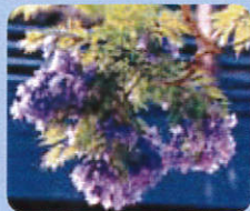
ジャカランダの花

ジャカランダが小浜温泉に植えられたのは昭和40年代、エチオピア暮らしの男性の「島原半島全体にジャカランダの花を咲かせて!」との願いから始まりました。