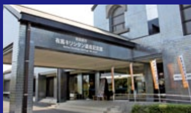
有馬キリシタン 遺産記念館