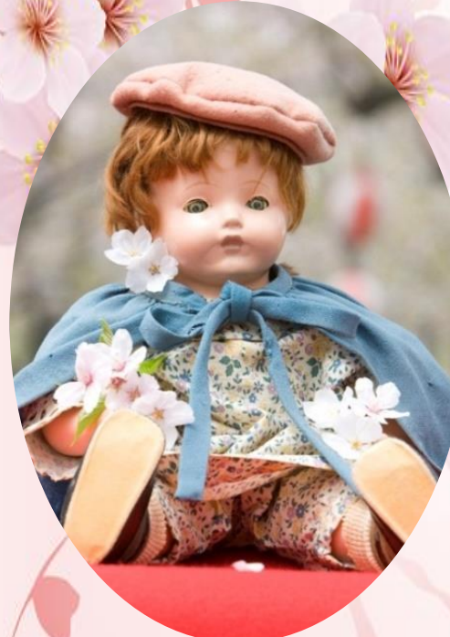
島原市指定文化財